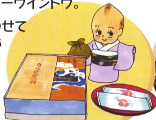
うのもりや (仲町 2-2)