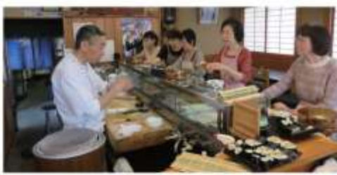
竹新寿司さんでは「意外と簡単!きれいな太巻き」の作り方を実施

今までに参加したことのある方も、まだ参加したことがない方もぜひ、この機会に参加してみませんか。参加店舗や講座内容などの詳細については、10月3日(土)新聞折