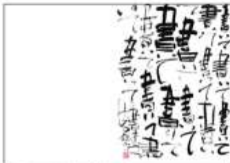
8月23日まで「まつだいカールペンハウス1階(十日町市)」にて展示会開催中。

ご依頼主の想いを受け止め、皆様の心の代筆者として作品にします。また、お菓子やお酒のラベルデザインもいたします。皆様にお染みのあるものでは、お土産として知られている「新濁り」や昨年から販売している吉乃川惣さんの「杜氏の晩酌」のラベルを制作いたしました。「筆人の会」では、