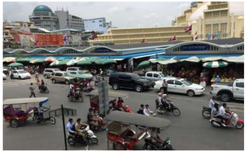
H29.9.8(木)PM2:20 カンボジアは、日本ではあまり馴染みのない国かもしれませんが。首都プノンペン市内は、人、車、バイクの熱気からこの国のエネルギーを感じます。