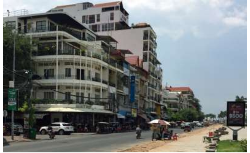
H29.9.7(木)PM6:19 昨晚、センモノロム市から7時間かけて首都プノンペンに戻ってきました。明日が最終日です。もうひと踏ん張りがんばります！