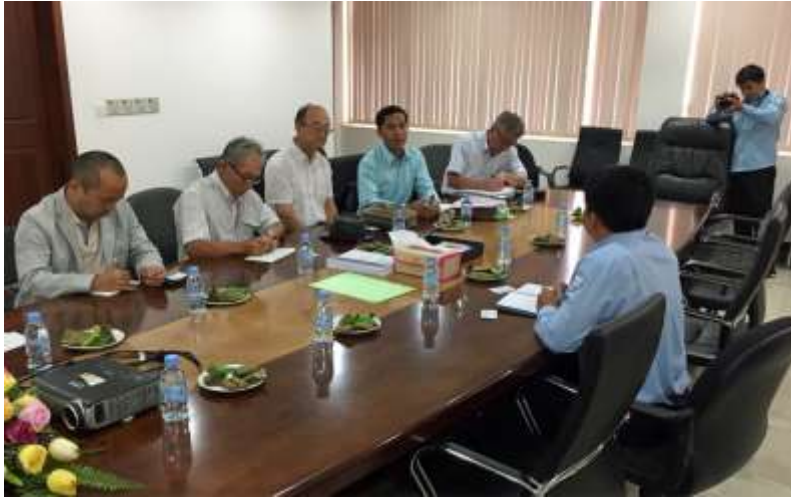
H29.9.7(木)PM0:00 電力公社プノンペン事務所にて今後の電化計画について情報収集してまいりました。