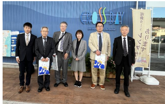
振興委員会視察研修会 10.24~25 富山県射水商工会議所を訪問し、まちづくり協議会の活動や地域活性化の取り組みについて研修した。