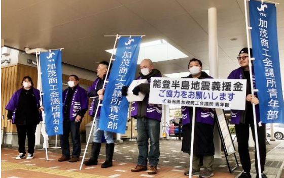
青年部が能登半島地震被災地支援 1月1日に発生した能登半島地震を受け、青年部では募金活動と炊き出し支援を2回実施。当所でも会員事業所に義援金を募った。