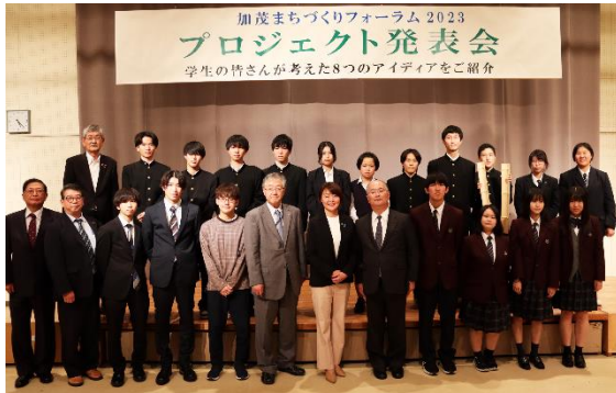
加茂まちづくりフォーラム 10.22 コンテスト形式で行い、書類審査を通過した7組が発表。優秀な3プロジェクトには活動支援金が渡された。