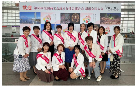
女性会全国大会が新潟で開催 10.5~6 加茂市でもエクスカッションが行われ、各県の参加者が花びら染め等を体験した。