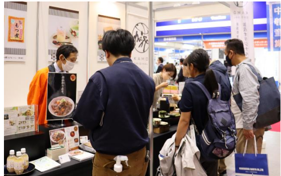
フードメッセ in にいがた出展 11.8~10 多くのバイヤーが集まる県内最大級の食の展示会。オリジナル推奨品認定事業者5事業所が参加した(於:朱鷺メッセ)。