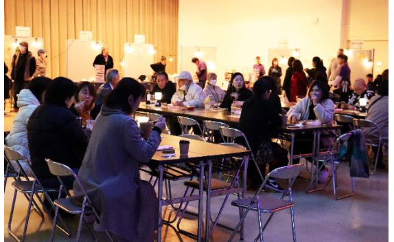
カモナイトパズル in 産業センター 2.16 産業センターを会場に開催。ホールでは飲食販売、DJ、ディスコを実施したほか、館内では体験イベント等も行った。