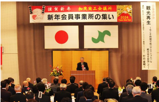
第48回新年会員事業所の集い 1.10 式典、記念講演、懇親パーティーを開催し、238名が出席。新春講演会にはインバウンド戦略アドバイザー村山慶輔氏を招聘