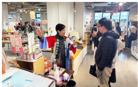
秋葉原でテストマーケティング 11.21~27 全国の食品を取り扱う秋葉原(東京)の店で、オリジナル推奨品を販売。