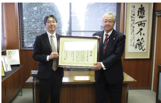
マル経制度発足50周年 11.10 マル経融資創設50周年を記念し、日本政策金融公庫より感謝状が贈られた。