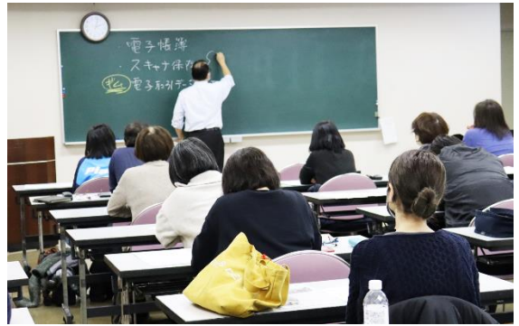
電子帳簿保存法セミナー 12.18 制度の概要と施行後の対応について研修した。47名参加。