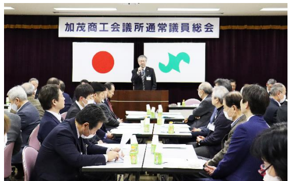
通常議員総会 3.27 令和6年度事業計画並びに収支予算が承認された。