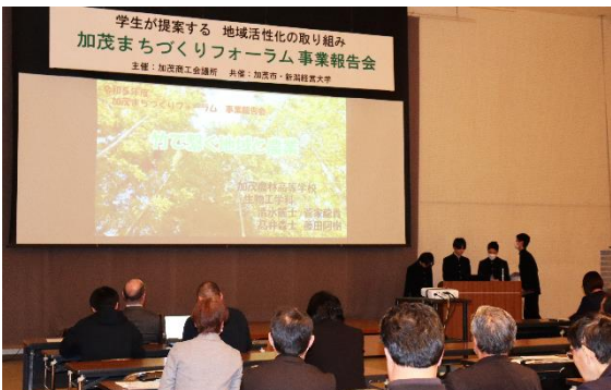
加茂まちづくりフォーラム報告会 3.16 10月に入賞した3プロジェクトの提案者が、これまでの活動内容等を発表した。