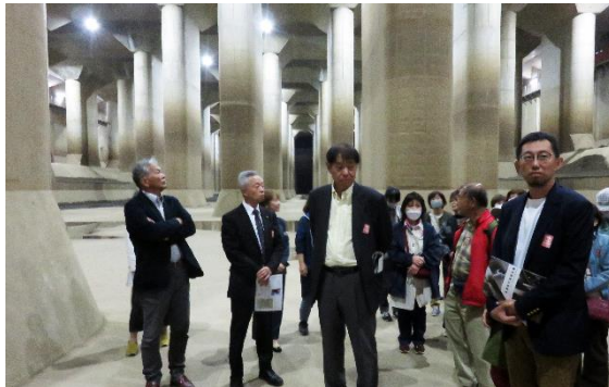
建設部会視察研修会 11.1~2 『災害に強い街づくり』をテーマに研修会を実施。首都圏外郭放水路や柏市に開発されたコンパクトシティを視察した。