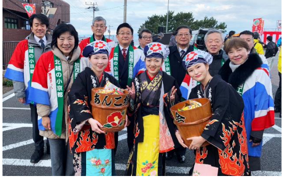
伊豆大島椿祭り親善訪問 1.27~28 新型コロナウイルスが5類に移行したことから訪問が実現。正副会頭、女性会・青年部会長等が訪問した。