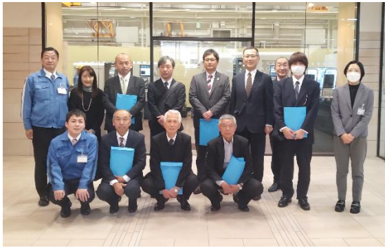
鉄工部会先進企業視察研修会 12.5 石川県白山市の複合機械メーカーを視察。最新の設備、DX化について研修した。