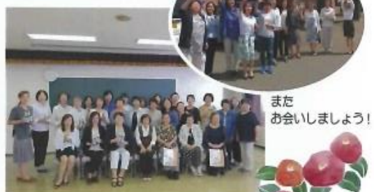
小高の皆様と記念撮影