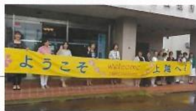
横断幕でのお出迎えにびっくり