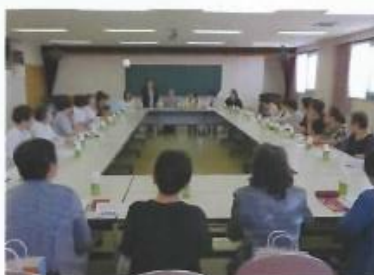
総勢32名が参加しました