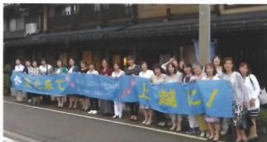
上越の皆様お世話になりました