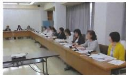
交流会風景 ちょっと緊張さみ?