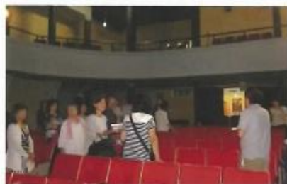
現存する日本最古の映画館「高田世界館」