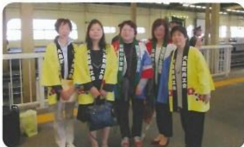
4月24日 燕三条にてお見送り

4月22日、加茂駅へお出迎え後、加茂商工会議所主催の歓迎夕食会に当女性会より6名が参加し、皆様と交流を深めました。