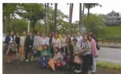
高田城をバックに