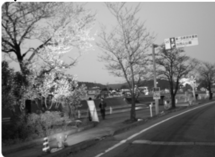
穀町左岸側桜並木